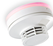
SecuriStar H MCD 573X-SCT