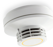
SecuriStar H CCD 573X